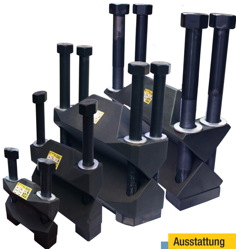
TONISCO® PS DN40, DN80, DN 125, DN150